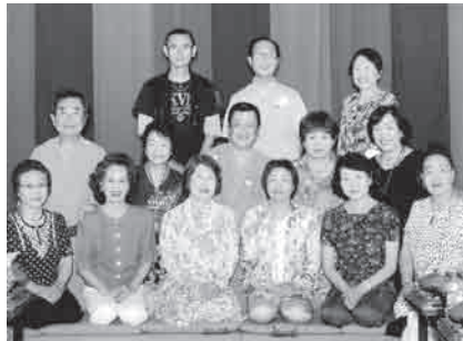
して、伊香保を後にした。 (伊勢崎支部 松島勝年)