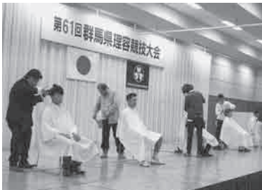
アトラクション (ヘアショー)

ホームページリニューアル! 群馬県理容専門学校 http://www.gunri.com/ 群馬県理容生活衛生同業組合 http://www17.ocn.ne.jp/gun.riyo/ ぜひ御覧下さい!