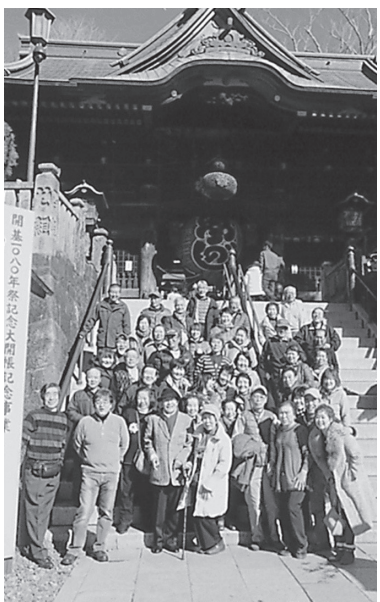
成田山新勝寺総門前で記念撮影

お寺としては、日本一の参拝客が訪れる新勝寺。鬼もひれ伏す不動明王様が本尊のため、ここには鬼がない。節分の豆まきは「鬼は外」は言わず「福は内」だけだそう。ここで、交通安全や家内安全を祈願する。開運厄除のお祓いもあるので思い当