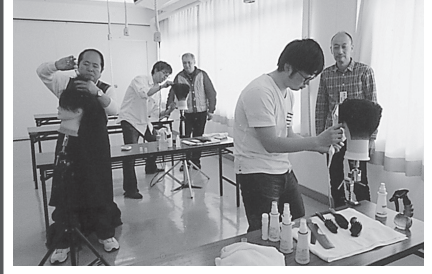
コンテストのテクニックを学ぶ受講生

200号に達するが、理容師法制定70年、生衛法制定60年の節目となる今年に改めて同法に目を通すのもよい機会かもしれない。 県組合行事予定 4月17日(月) 第64回群馬県理容競技大会 5月29日(月) 理容組合総代会 6月26日(月) 県ボウリング大会 7月18日(火) 第61回関信越理容競技大会 7月24日(月) 組合講習会 9月11日(月) 理容ボランティアの日 9月18日(月) 関東甲信越フットサル大会 未定 理容感謝祭 10月2日(月) 西毛巡回講習会 10月9日(月) 学園祭 10月16日(月) 第69回全国理容競技大会 10月30日(月) 東毛巡回講習会 11月 女性理容師の日 11月13日(月) 北毛巡回講習会 ※『みやま』編集部では皆様からの投稿・寄稿をお待ちしています。300から500字程度で、イベントや催し物はもちろんその他、組合員やご家族の特技・趣味、ご本人の自慢話でも大いに結構です。 お問合せ・各地区広報部員または兼事務局027-221-9804まで