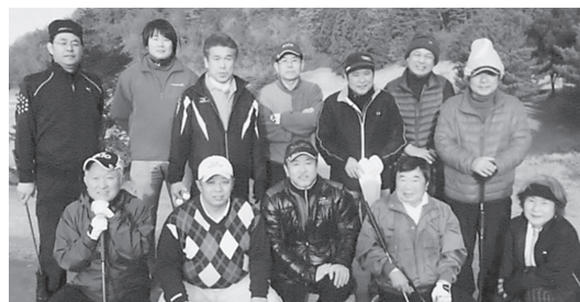
太田支部ゴルフコンペ参加者

平成28年12月19日(月) 城山カントリー倶楽部にゴルフコンペを行った。当日は風もなく12月にしては温かい日で絶好のゴルフ日和だった。競技方法は持ちハンデいで、NETにて争った。