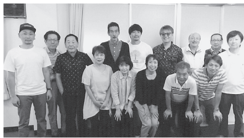
優勝おめでとう! 桐生チーム

東毛地区理容親善 チャリティーゴルフ大会 平成29年10月2日(月)第11回東毛地区理容親善チャリティーゴルフ大会が太田支部主催により城山カントリー倶楽部にて参加者43名で行われた。競技方式は個人の部新ペリア・団体の部は各支部上位5名のグ