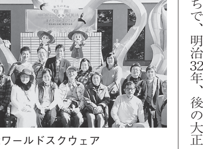
東武ワールドスクウェア

下りると広さ2万平方メートル、野球場が一つ入るくらい巨大な地下空間があり皆さん驚愕していた。ここはPV、映画、テレビCMの撮影場所になっている。