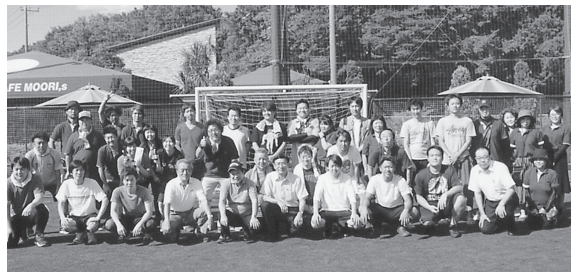
関東甲信越群馬大会

平成29年9月18日(月)第8回関東甲信越フットサル大会が群馬県で開催された。台風の影響も心配しましたが、朝から晴天に恵まれ無事開催に至った。今回は地元開催ということもあり、群馬から2チーム出場し理容学校の生徒さんも参加してくれた。結果はAチームが6位、学生主体のBチームが8位という成績だった。学生との交流もあり、組合事業に対する理解や楽しさを伝えることはできたと思う。大会に尽力いただいた