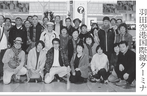
日光田母沢御用邸記念公園にて

碓氷支部親睦一泊旅行 秋彩の那須 塩原温泉郷 平成29年11月6日(月)7日(火)、碓氷支部では組合員親睦旅行を行った。今回は「のんびり温泉旅行」をテーマに秋の紅葉シーズン、バスは那須塩原方面へ。初日の大谷石資料館では深さ30メートルある階段を