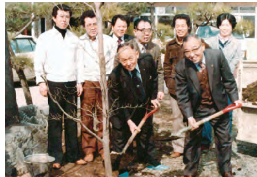
昭和 54 年の理容学校 植樹祭