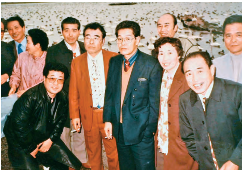
昭和60年頃の渋川支部旅行