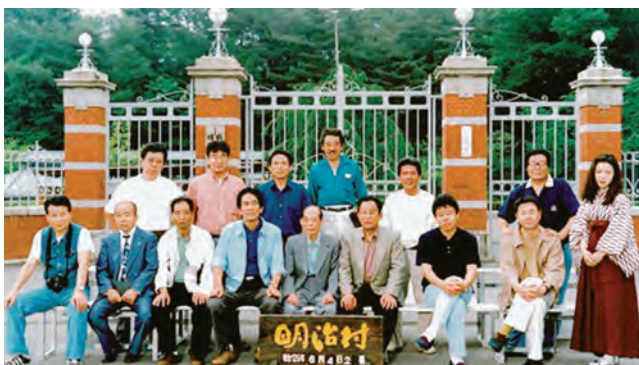
平成 10 年頃の多野支部旅行