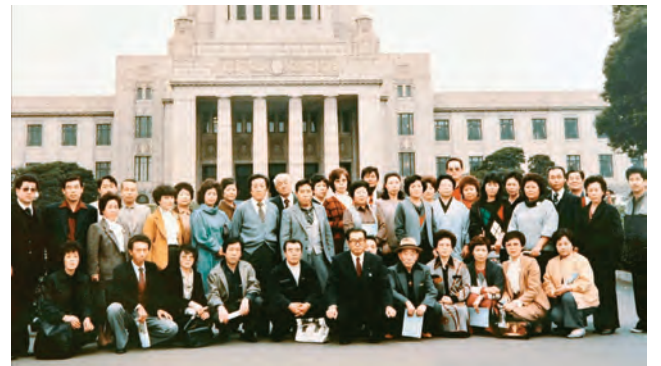
昭和 60 年頃の渋川支部旅行