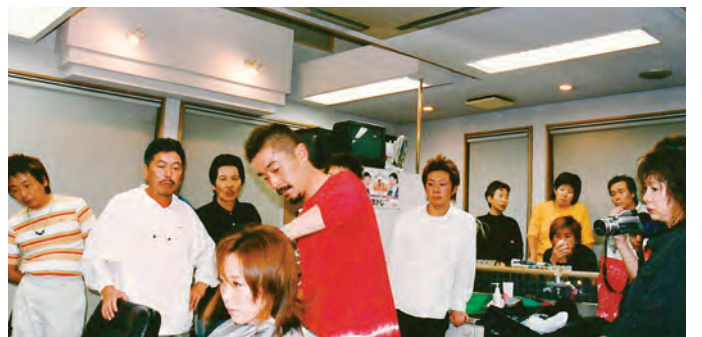
平成20年頃の講習会の様子