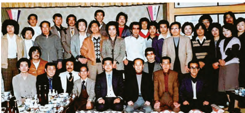
昭和 50 年代後半の太田支部の方々