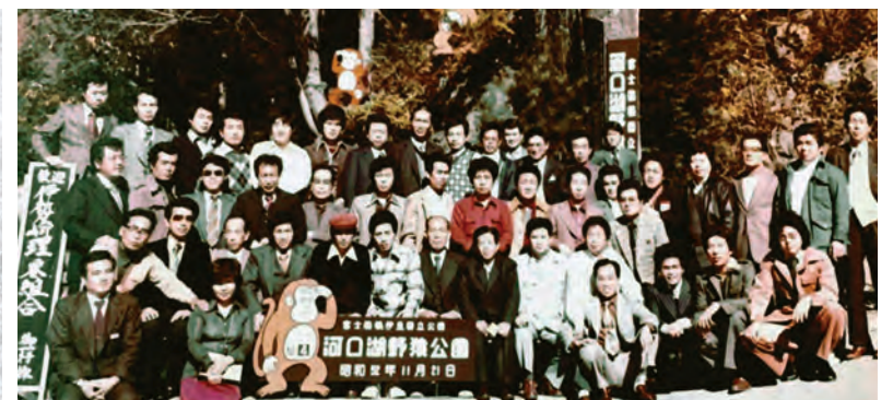
昭和 50 年頃の伊勢崎支部旅行