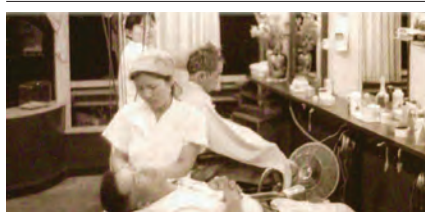
昭和40年代の営業風景