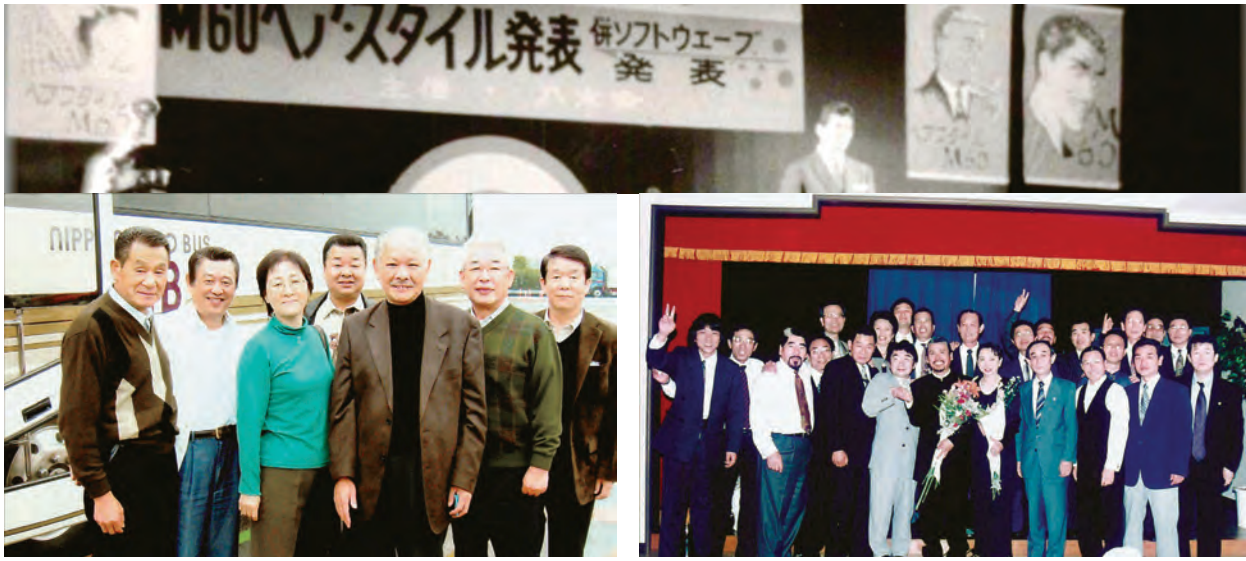
平成 20 年頃の県役職員研修旅行