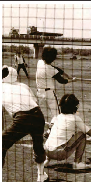
ソフトボール大会