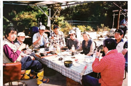
平成 10 年頃の前橋支部マス釣り交流会