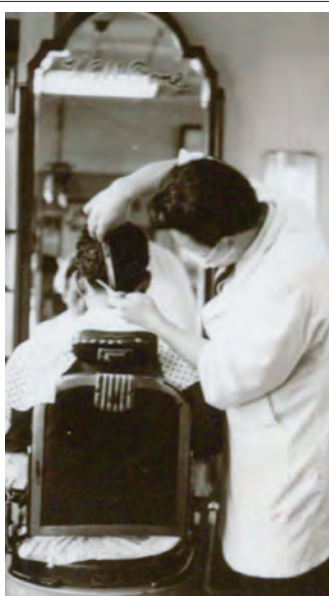
昭和30年代後半の店舗