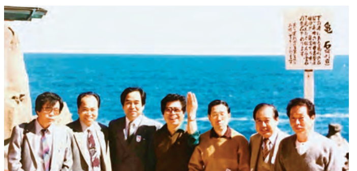
昭和50年代の伊勢崎支部旅行