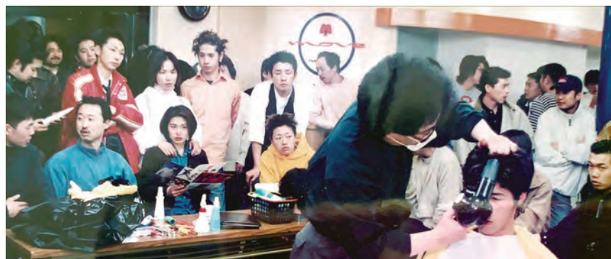
平成 10 年頃の講習会の様子