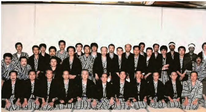
平成 10 年頃の前橋支部旅行