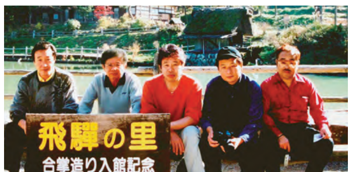
平成10年頃の多野支部旅行