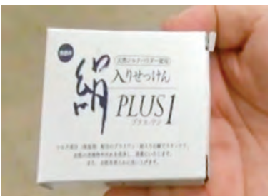
講習内で使用した石鹸