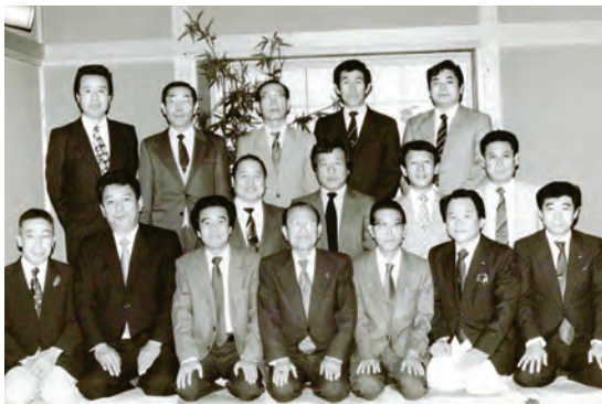
昭和 50 年頃の桐生支部役員の方々