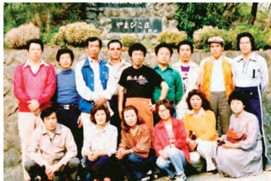
昭和 50 年代の碓氷支部旅行