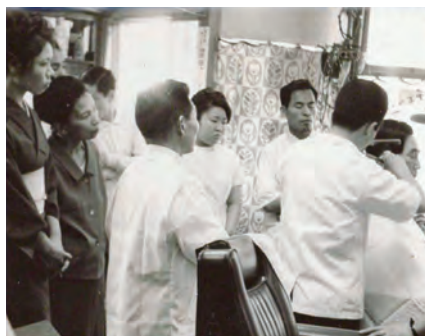
昭和40年代の店舗講習風景