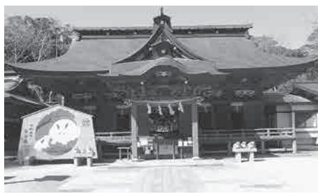
最終目的地の大洗磯前神社