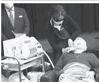
脱毛機シェブノン5

し、除毛・減毛できる。毛量、毛質、肌に合わせて5つのモードが選べ、各モード4段階の照射レベルを選択できる最新モデル。環境を整えて、お客様へ機器の使用法を説明すれば、セルフ脱毛メニューができる」と説明した。