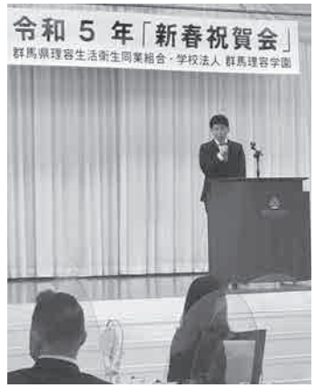
山本一太県知事の挨拶

1月23日(月)ロイヤルチェスター前橋において、県理容組合並びに県理容学園主催による新春祝賀会が開催された。 まず挨拶に立った山口理事長は「理容業は生活関連業で休業要請なく協力金なしで営業を続けてきた。この3年で各店舗の売上がダウンしていると思う。これからコロナが終息へと向か