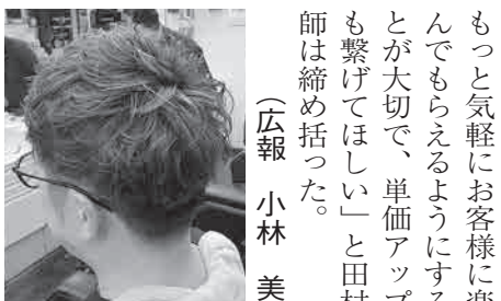
アンニュイ感じの緩パン

40代男性モデルは、トップと前髪はあまり切らないで、まわりスツキリのフロント系を希望。田村講師は、丁寧なブロッキングとクリップワークで刈り始め、裾の色彩から隠れて見えなくなる細部までこだわった綺麗な2ブロックス