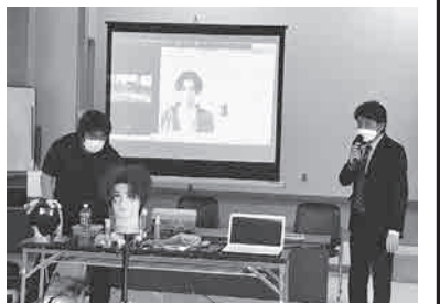
今回のスタイルを説明

細かく丁寧なブロッキングから始まり、カット、必要な場所に今流行りの波巻きパーマをかける技術を披露した。 仕上げは、濡れた感じにウエットに仕上げるとリッジが出て良い。 「こういったスタイルを