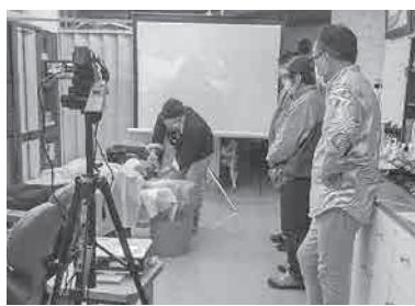
講習はリモート配信も行った