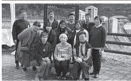
紅葉をバックに笑顔の皆さん

初日は午後には集合、中之条交流センターつむじにて休憩をし、宿に到着。翌日は奥四万湖のダムを見学し、奥四万ブルーを堪能した後、続けて八ッ場ダムも見学した。資料館でダムの建設計画から完成までを見て、エレベーターでダムの下まで降りたが、ダムの巨