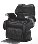
LEGEND II 月々11,000円~