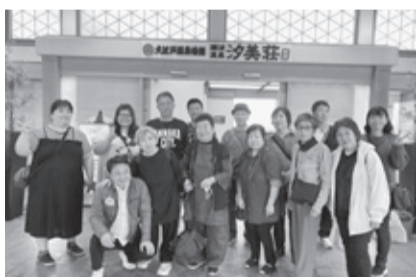
大江戸温泉物語汐美荘ロビーにて

碓氷支部 新潟の旅 令和5年11月5(6)日、碓氷支部14名で1泊旅行を開催した。コロナ禍から開けての旅行としては2年目、観光バスを使う旅行としては4年ぶりの開催である。前年は自家用車3台での開催だったので、久しぶりのバス旅行になった。1日目の昼食は、新潟市のピアBarで海鮮料理を味わった。宿泊地は大江戸温泉物語汐美荘。今年6月にリニューアルした建物はとても綺麗で景色も良く、久しぶりにゆつくりした時間を過ごす事ができた。早目に到着した宿で、夕食前にラウンジで一杯飲んだり、日本海を見ながらお風呂を楽しんだ。夕食バイキングも美味しく、メニューも豊富でよかった。翌日は鮮魚センターで買いたての魚を堪能し、群馬に戻りリクエストの多かった道の駅まえばし赤城に立ち寄った。久しぶりのバス旅行はとても盛り上がり、笑い声が絶えない車内であった。 (広報 長滝 健一)