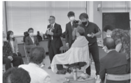
西毛でのアイロン講習会

令和5年11月13日(月)東吾妻町中央公民館において、第44回北毛協議会にて組合講習会が開催され、リモート参加も含めて約50名の方が参加した。