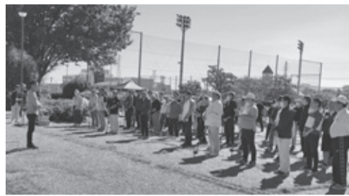
好天の下第1回開会式

コースで構成。1ホール目からワンが入り歓喜の聲が上がったり、芝の目や深さで苦戦する声が聞こえたりと様々だった。