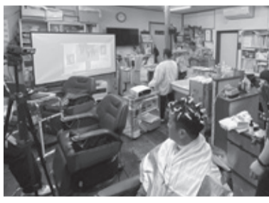
パワーポイントを使い説明