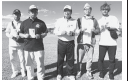
第1回大会 入賞された選手の方々