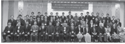
第49回青年女性部協議会 群馬大会参加者

第49回全国理容生活衛生同業組合連合会 関東甲信越協議会 青年部女性部連絡会議 群馬会議を令和5年11月20日(月)グランビユー高崎にて「BARBER'S EGOIST」へ今あなたは楽しく仕事できていますか？をテーマに各都県から63名の青年女性部員が集まり開催された。