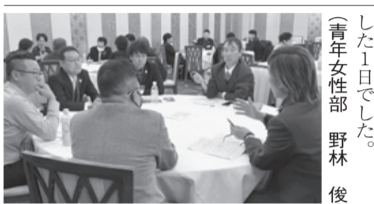
グループディスカッションの様相

第49回全国理容生活衛生同業組合連合会 関東甲信越協議会 青年部女性部連絡会議 群馬会議を令和5年11月20日(月)グランビユー高崎にて「BARBER'S EGOIST」へ今あなたは楽しく仕事できていますか？をテーマに各都県から63名の青年女性部員が集まり開催された。