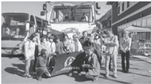
水陸両用バス「にやがてん号」の前で

多野支部 紅葉のハッ場ダムへ 令和5年11月7日(火)多野支部は、ハッ場ダムへバス旅行に行った。朝は雨模様だったが道の駅こもちで買いたての秋味と澄み渡る秋晴れとなった。ダムサイトを見学後、地下3階へ。上を見上げるとダムスケールの大きさに圧倒された。その後、浅間酒造観光センターにて昼食。午後になり、楽しみにしていた水陸両用バス「にやがてん号」へ。坂を下り、水しぶきを浴びながら湖面にダイブ。湖上からしか見られない鮮やかな紅葉は最高だった。帰路の途中、道の駅くら