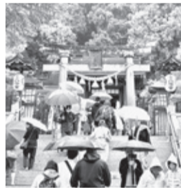
荘厳な櫻山八幡宮

旅行の秋 各支部旅行 江戸の面影を残す街並みに日本人のみならず、海外からの観光客も堪能していたようだった。ランチは各自で選べ、ご当地名物である飛騨牛ステーキや高山ラーメンを味わえた。今回はハードスケジュールではあったが団体バスならではの楽しみを満喫できた。次回の企画を楽しみだ。 (教育 岸 由郎)