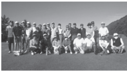
15回目を数えるチャリティーゴルフ大会

閉会式では、入賞のほか飛び賞やホールインワン賞もあり、賞金や賞品を獲得した選手は笑顔が溢れていた。盛況に開催された県初の大会の成績は次の通り。