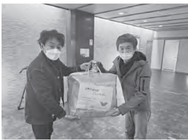
石川県に届いたタオル

群馬県青年女性部では、石川県組合の女性部長と連絡を取り、被災地への支援について話し合いました。震災直後、石川県女性部長からは能登地区との連絡が途絶えており、現地の状況が分からないということでした。私たちはタオルの