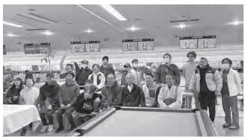
参加者の皆さんと記念写真

昨年よりも参加者が増え白熱した大会となり、歓声や笑い声も溢れる一日となった。成績では200を超えるハイスコアも出るなど、ゲームの行方は目を見張るものがあった。こういった組合の行事で組合員同士の交流が生まれることはとても嬉しく、さらに参加者が増えることを