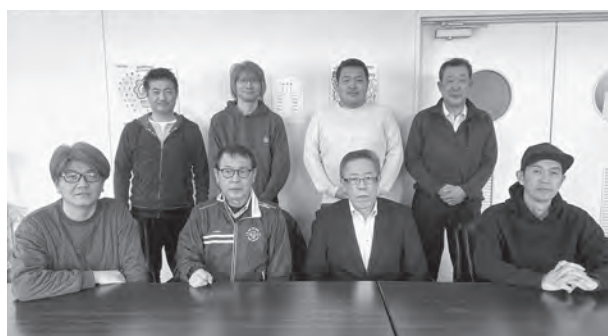
三年間の任期を終えた編集委員

今年「みやま」編集会議198号から始まり、この年「みやま」創刊200号という記念的な節目に特集号を組みました。