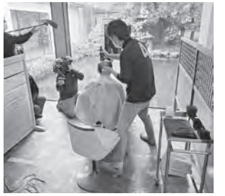
被災地でのボランティア

在庫がある事と、必要ならば送る用意がある事を伝えました。その後、能登地区の被害が甚大であることが報道され、私たちは何かできないかと考えました。