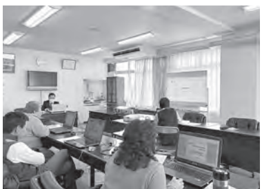
真剣に受講する組合員さん

この講習会は組合員のスキルアップのために企画され、第1回は基礎講座、第2回はワード講座、第3回はエクセル講座が行われた。パソコン上級者の久保弥