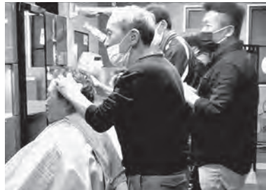
相モデルで実演する皆さん

実践形式で施術者・モデル3組に分かれ、ヘッドスパ・癒しほぐしの運行順序・効能・単価説明を直接伝授され、続いてメディアでも紹介された鼻毛抜きや簡単にできる2種類のバック情報をお教えいただいた。自分を含め我々理容師は、『サービス業病』にな