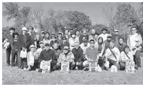
東毛大会の参加者

令和6年11月4日(月) 太田市数塚本町中央公園多目的広場に於て、第3回東毛地区親善グラウンドゴルフ大会が行われた。 東毛各支部から35名の選手が集まり、腕を競い合った。隣の野球グラウンドでは子供達が大きな声を出して野球の試合をしていたが、こちらの大会もボールの行方に負けじと笑い声が響く賑やかな大会となった。