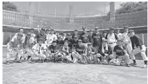
青空の下 三支部で

令和6年9月2日(月) 東毛ソフトボール大会が伊勢崎市ソフトボール球場で行われた。当日は台風の影響が心配されたが、奇跡的な晴天の中、開催された。 大会は伊勢崎、太田、桐生(邑楽は人数不足で不参加)の3チームで総当たり戦方式で行われた。 第1試合は太田と桐生、桐生打線が爆発して序盤から大量得点。太田は後半なんとか得点を取ったが、14-4で試合終了。 第2試合は伊勢崎と太田、伊勢崎は前半で打者一巡するなど大量得点。後半太田が盛り返したが、10-5で試合終了。 第3試合は桐生と伊勢崎、桐生は打線が爆発して終始大量得点を取った。伊勢崎は健闘も虚しく、17-0で試合終了。 結果は以下の通り 優勝 桐生チーム 準優勝 伊勢崎チーム 第3位 太田チーム 皆、笑顔で大会は終了した。 (広報 松島 雄一)