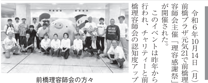
前橋理容師会の方々

講師の店舗では眉毛の施術を別メニュー化している。営業での眉毛メニューなどの説明があり、その後の実践では、眉毛の不要な部分を取り除くシミュレーションで、お客様の眉毛にアイブローペンシルを使い、不要な部分をわかり